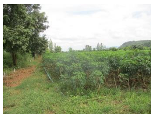
พื้นที่เกษตรกรรมใกล้เคียง (ไร่อ้อย, มันสำปะหลัง)