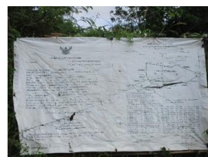
ป้ายแสดงรายละเอียดโครงการ