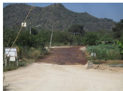
ถนนเข้า-ออกด้านหน้าพื้นที่โครงการ