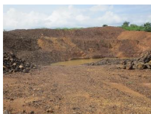
พื้นที่หน้าเหมืองปัจจุบัน (บริเวณพื้นที่ บริษัท พร็อพเพอร์ตี้ โปรเซส จำกัด รับช่วงการทำเหมือง)