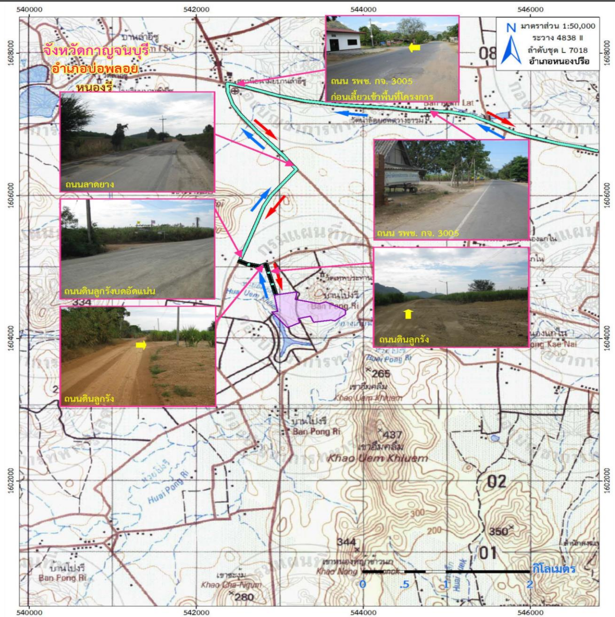
รูปที่ 1-3 แสดงการคมนาคมเข้าสู่พื้นที่โครงการ