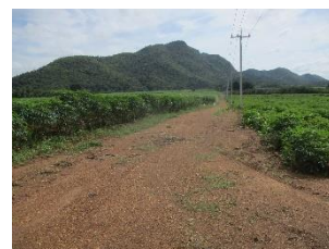
ทางสาธารณประโยชน์ ผ่านแนวหลักหมุด 11-12-13-5-6

ที่มา : www.googleearth.com (2564) และการสำรวจของภาคสนาม (2565)